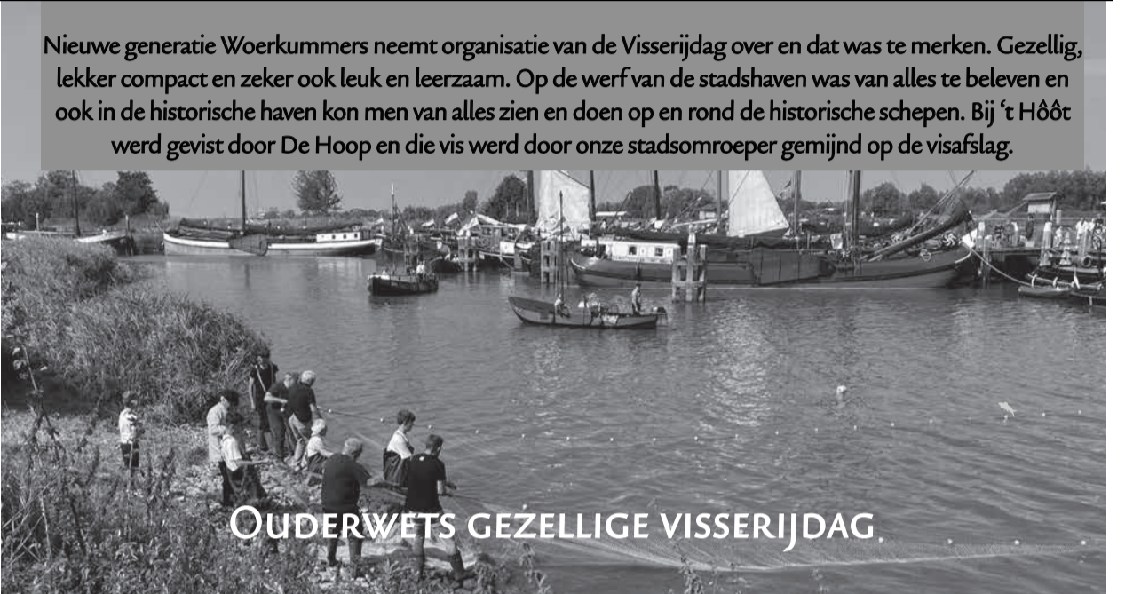
Nieuwe generatie Woerkummers neemt organisatie van de Visserijdag over en dat was te merken. Gezellig, lekker compact en zeker ook leuk en leerzaam. Op de werf van de stadshaven was van alles te beleven en ook in de historische haven kon men van alles zien en doen op en rond de historische schepen. Bij 't Hôôt werd gevist door De Hoop en die vis werd door onze stadsomroeper gemijnd op de visafslag.