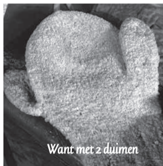
Want met 2 duimen

Heb je er wel eens aan gedacht wat er gebeurt als de huidige middenstand waaronder de horeca verdwijnt? Ik wel, en dat is geen leuk vooruitzicht. Er is nogal wat horeca verdwenen de laatste jaren. Laten we met z'n allen op de barricaden gaan en vanaf vandaag minimaal één keer per week een kop koffie, pilsje of wat dan ook bij onze horeca halen. We helpen ze de winter door, want we zijn van elkaar afhankelijk om een levendig stadje te blijven!