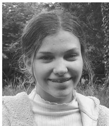
MILL VAN GAMMEREN