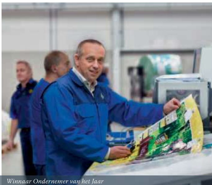
Winnaar Ondernemer van het Jaar

Kleibergsestraat 4, Genderen 0416-358100 info@oerlemansplastics.nl www.oerlemansplastics.nl