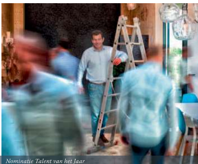
Nominatie Talent van het Jaar

"Hierdoor worden onze producten 100% veilig geproduceerd voor de voedsel- en pharma industrie. Als onderneming lopen we graag voorop; zo zijn we actief met het ondernemingsdossier (digitale milieuvergunning) en zijn we koploper in het project Clean Sweep. De belangrijkste ondernemingsdoelstelling is continuïteit op lange termijn. Er wordt flink geïnvesteerd in alle OPACK-bedrijven. Een ander speerpunt in de onderneming is innovatie. Sinds 1992 produceren we al biodegradable en ultradunne folies."