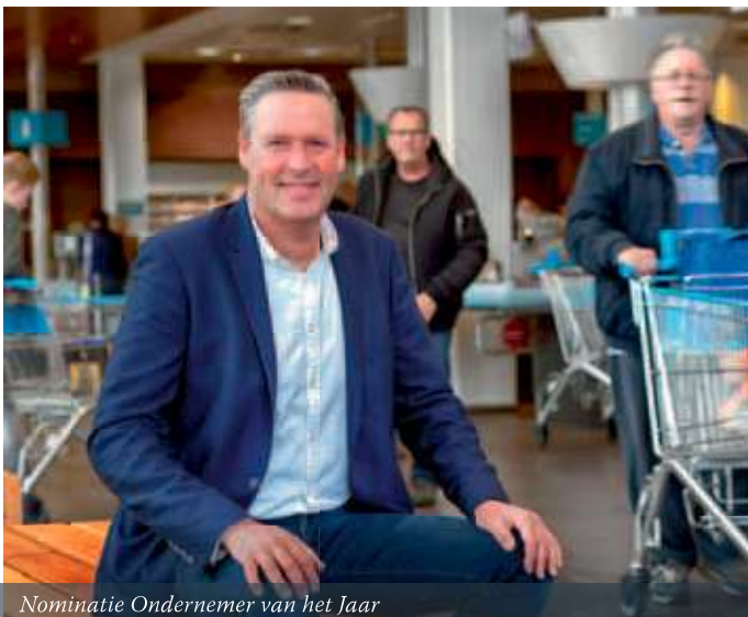
Nominatie Ondernemer van het Jaar

schouten SPECIALIST IN PLANT-BASED PROTEIN FOODS