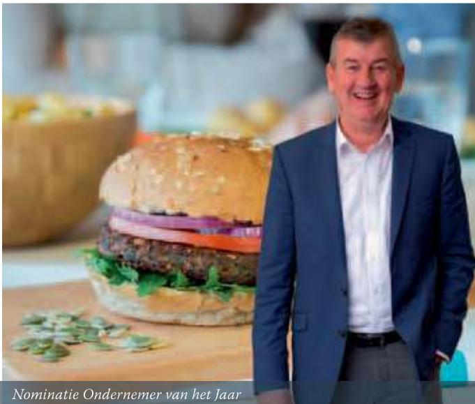
Nominatie Ondernemer van het Jaar

Burgstraat 12, Giessen 0183-446373 info@schouteneurope.com www.schouteneurope.com